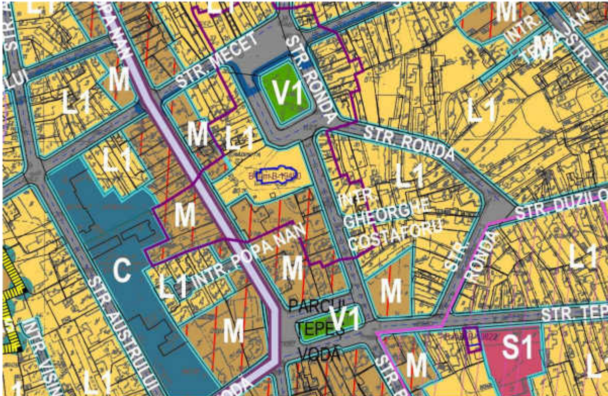
Extras din PUZ Sector 2, aflat in faza Informarea Populatiei, Faza a III-a

Avand in vedere cele prezentate mai sus, va aducem la cunostinta că reglementarile urbanistice finale se vor stabili în urma avizării proiectului P.U.Z. la instituțiile abilitate în acest sens, și dezbatute în cadrul Comisiei Tehnice de Circulații, Comisiei de Mediu, cat și a Comisiei Tehnice de Urbanism din cadrul Primăriei Municipiului București, ce sunt obligatorii în cadrul procedurii de avizare a Planului Urbanistic Zonal al Sectorului 2 al Municipiului București.